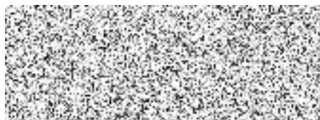
Mgr. Jakub Lapáček

Potvrzení neexistence požadovaných údajů v bodech 1, 2, 4, 7, 8, 9, 11 provedl povinný subjekt interním šetřením dne 26. 1. 2026 viz příloha tohoto sdělení.