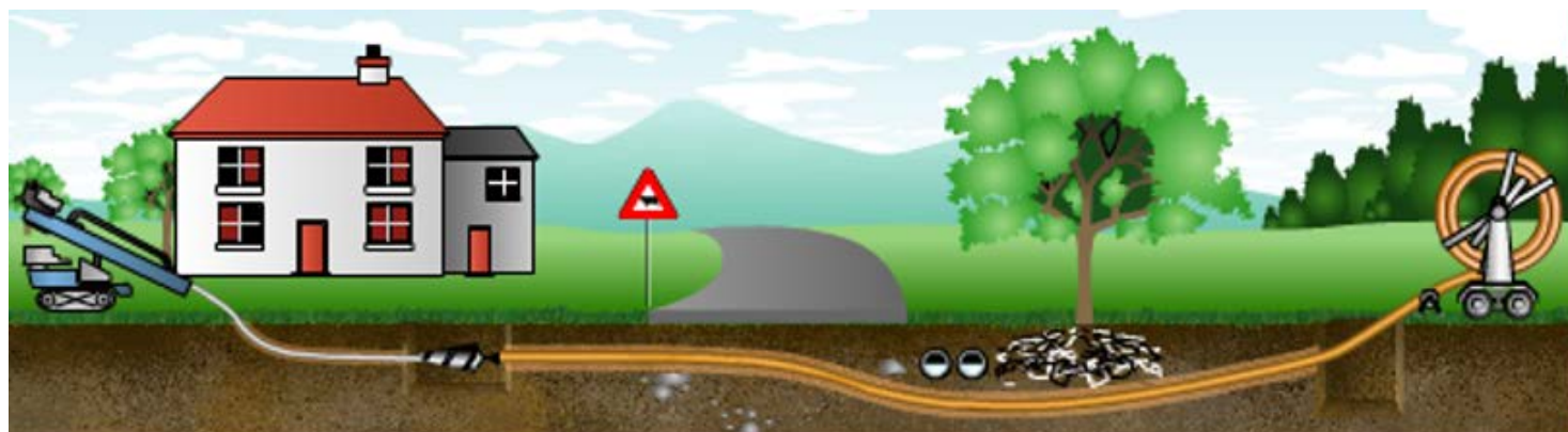
Ilustrace bezvýkopové metody horizontálního směrového vrtání, jak je použita při stavbě kanalizace ve Všedobrovicích a Štíříně.

Přečtěte si informace radnice k přípojkám a používání čerpadel