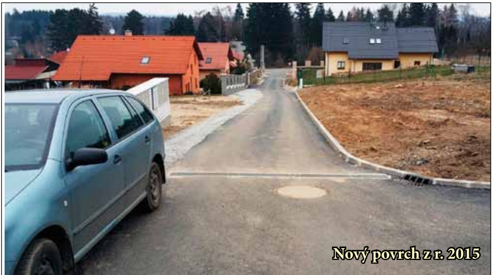
Nový povrch z r. 2015