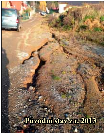
Původní stav z r. 2013