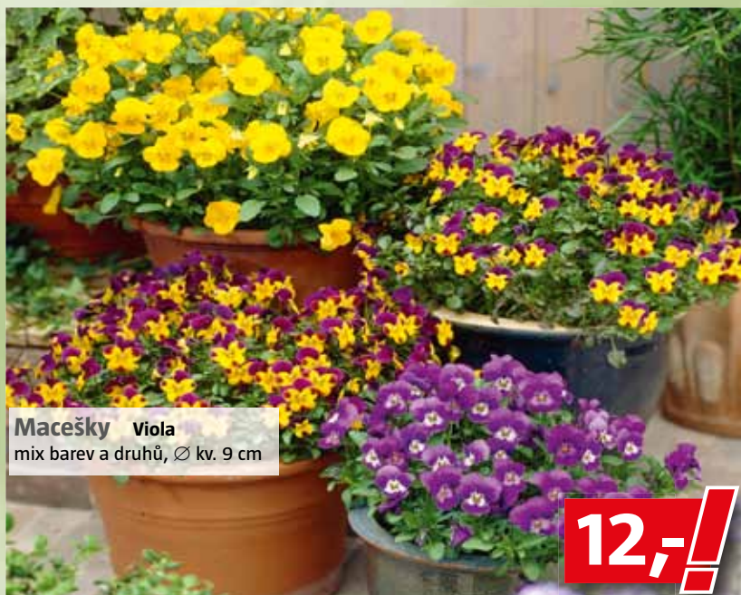
Macešky Viola mix barev a druhů, Ø kv. 9 cm

k. z. Průhonice – Čestlice NEJŠIRŠÍ VÝBĚR ZA NEJLEPŠÍ CENY!