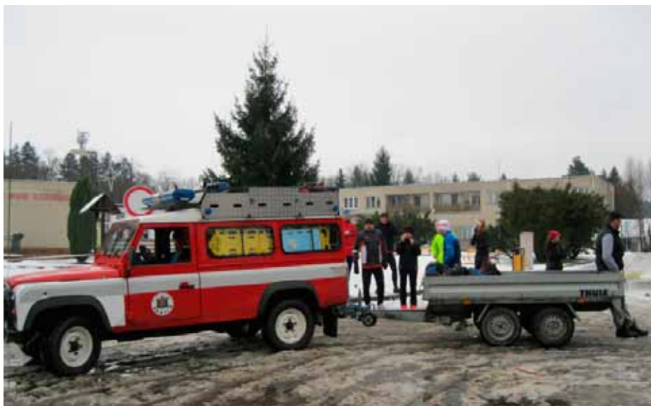
Asistence při novoročním běhu 1. 1. 2015

Na závěr bychom chtěli poděkovat všem aktivním členům jednotky za jejich zášahovou činnost, ale také za dobrou údržbu techniky a výstroje a v neposlední řadě za účast na odborné přípravě a praktickém výcviku. Za podporu rovněž děkujeme zřizovateli jednotky obci Kamenice a Hasičskému záchrannému sboru Středočeského kraje se sídlem v Kladně, Územnímu odboru Kladno, stanicím Jílové u Prahy, Říčany u Prahy a Benešov u Prahy, se kterými spolupracujeme nejen při zášahové činnosti, ale i při řešení běžných provozních záležitostí jednotky. Děkujeme rovněž okolním jednotkám a sborům se kterými se setkáváme jak u zásahů, tak při odborné přípravě a výcviku. -sdh-